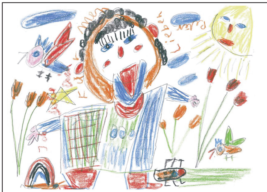
Für meine Lieben. Menschen mit geistiger Behinderung haben inhaltlich und gestalterisch an der Erstellung der Broschüre mitgewirkt.

Das hier Beschriebene zeigt, dass Langeweile und Stillstand für die Arbeitsgruppe nicht zu erwarten sind. Die vielen positiven Rückmeldungen aus Deutschland, der Schweiz und Österreich zeigen, wie wichtig und notwendig eine solche PV für Menschen mit geistiger Behinderung ist, um diesen Personen die Möglichkeit zu geben, individuell ihre Wünsche und Vorstellungen bezüglich ihres eigenen Sterbens in Würde auszudrücken. Dies ist und bleibt eine Motivation für uns, dieses stets spannende Projekt weiter voranzutreiben, auch wenn der zeitliche Mehraufwand neben den Hauptberufen der einzelnen Mitglieder nicht unerheblich ist. Aber die Arbeit macht viel Freude, da sie in einer angenehmen, offenen, freundlichen und konstruktiven Weise geschieht. In diesem Sinne: immer weiter im Prozess...! ■