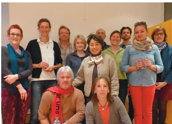
Die Absolventen des 17. Befähigungskurses im Mai 2014